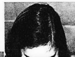
Mladé ženě krátce po dvacítce vypadaly vlasy nad čelem a na temeni v důsledku operace a následné radioterapie. Protože celá tato oblast byla zcela bez vlasů, nedařilo se jí zakrýt vlasy z té části hlavy, kde má vlasů dost